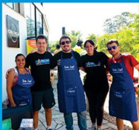
Evento de conscientização e identificação de animais na Academia Céltica, em novembro de 2013.