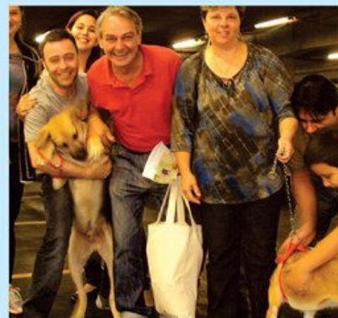
40 feiras no Maxi Shopping