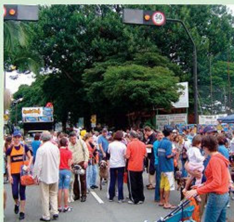
2008: Avenida dos Ferroviários