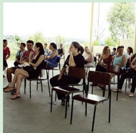
Santa Gertrudes - 62 animais castrados