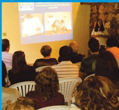
Palestra sobre Comportamento Animal, em abril de 2013.