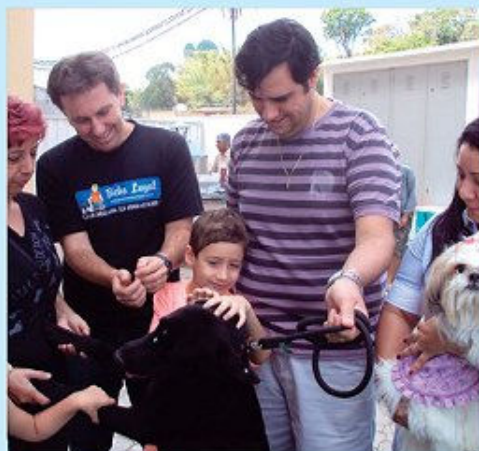
Feira na Malota