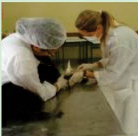
Jardim Tarumã - 52 animais castrados