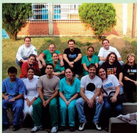
Vila Maringá - 111 animais castrados