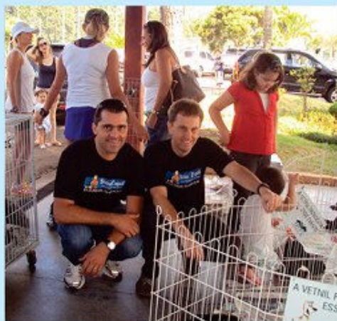
2 feiras no Clube Jundiaense