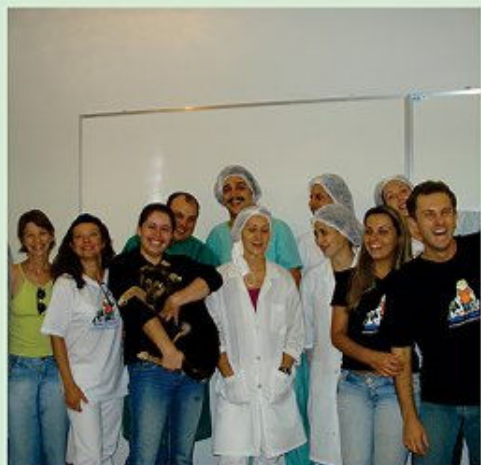
ESEF - 6 mutirões e 548 animais castrados

Foram 865 animais atendidos em vários bairros de Jundiáí. Tudo isso graças ao trabalho de nossos voluntários e parceiros.