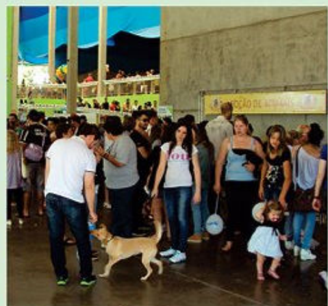
2012 e 2013: no Estimacão