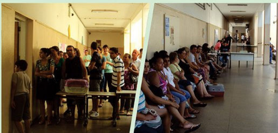
Vila Arens em 2013 : 92 animais castrados