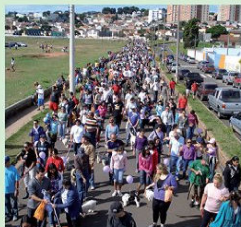
De 2009 a 2011: em frente ao Extra